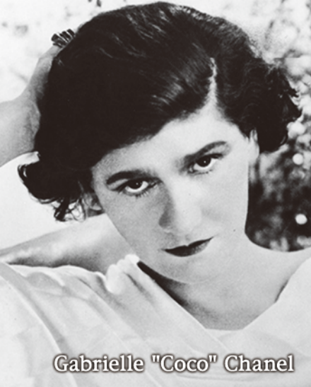
Gabrielle "Coco" Chanel